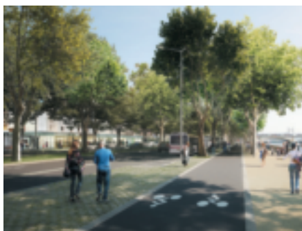
Après son déclassement, l'A6/A7 laissera la place à un boulevard urbain apaisé sur la rive droite du Rhône.

Plus d'informations sur : www.grandlyon.com . ■