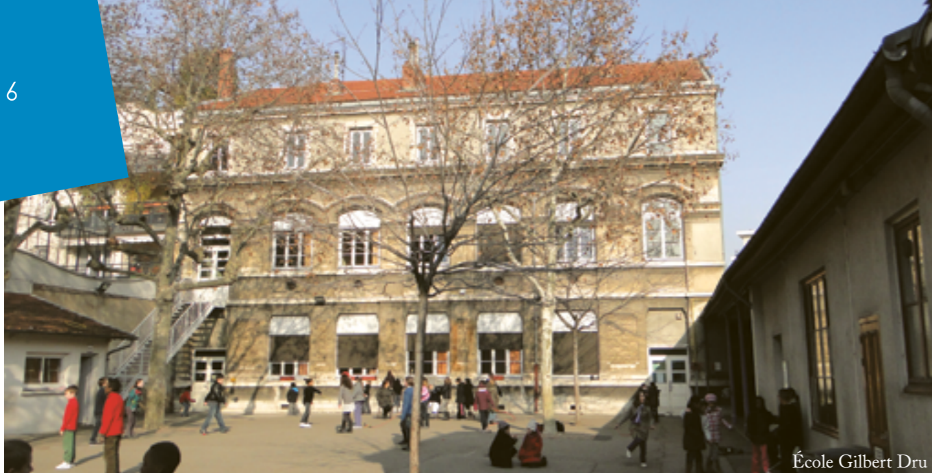
École Gilbert Dru