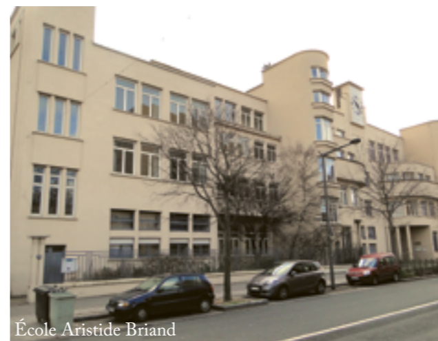
École Aristide Briand