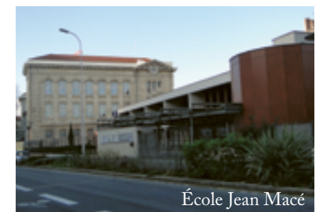
École Jean Macé