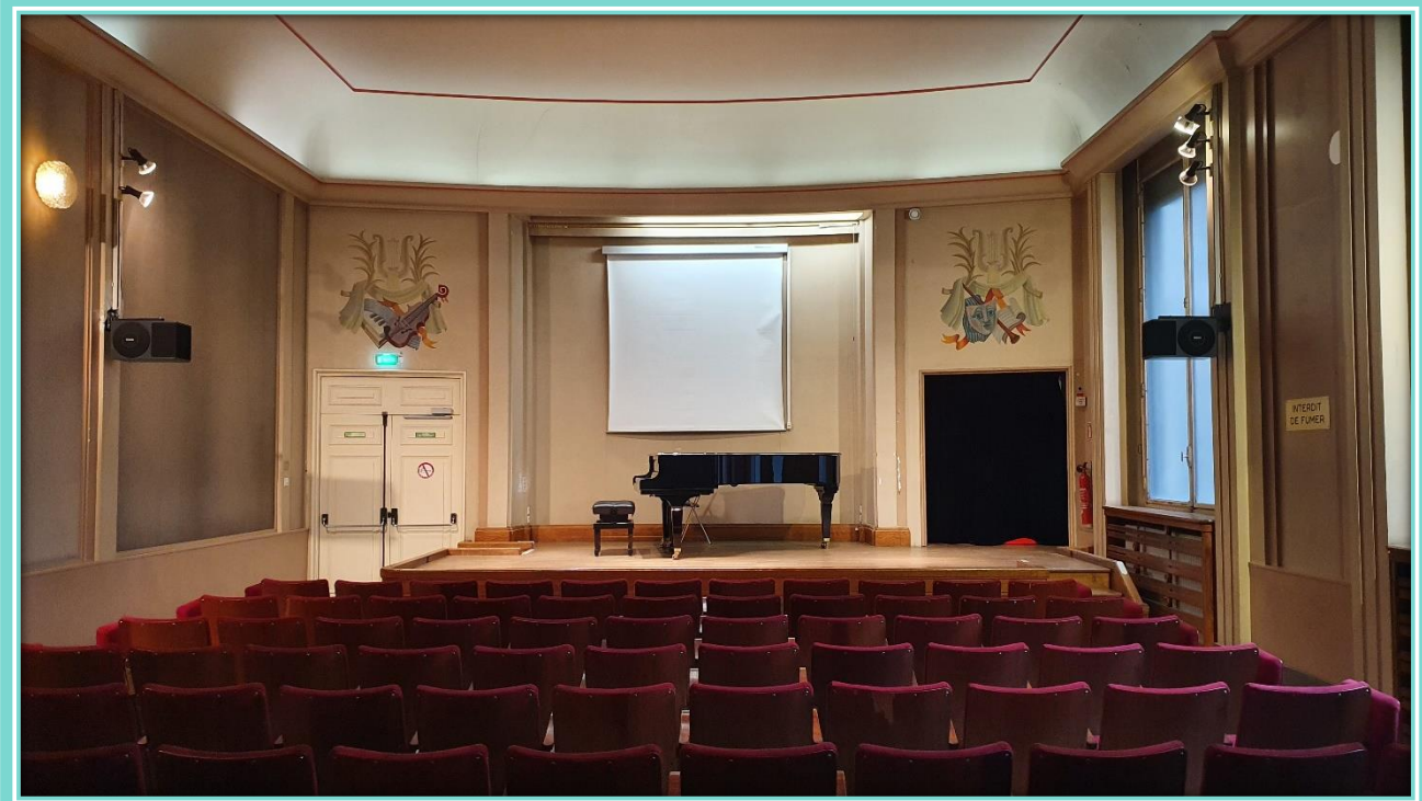
Piano : Ibach Richard Strauss